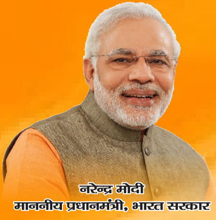
नरेन्द्र मोदी माननीय प्रधानमंत्री, भारत सरकार