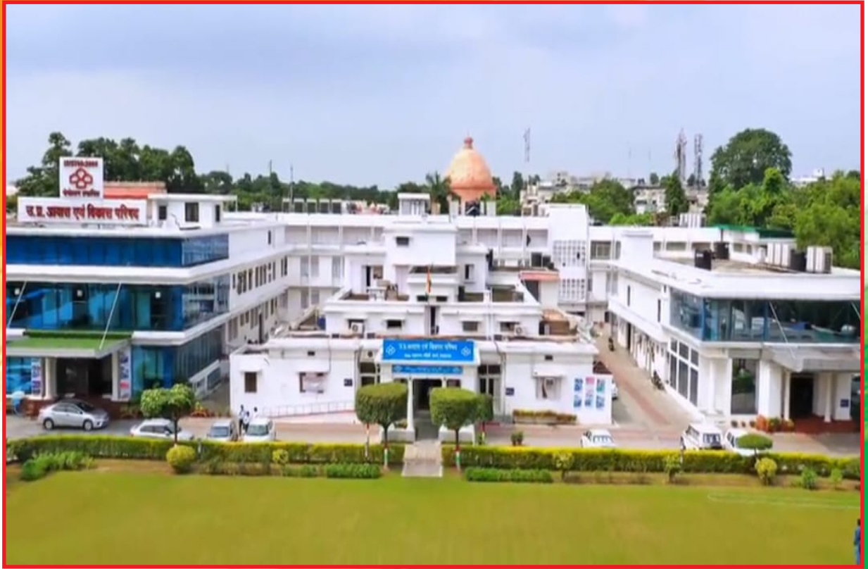
उ.प्र. आवास एवं विकास परिषद, मुख्यालय लखनऊ