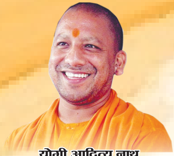
योगी आदित्य नाथ माननीय मुख्यमंत्री, उ.प्र.